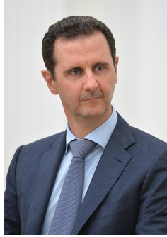
นายบะซาร์ อัลอะซัด (Bashar al-Assad)