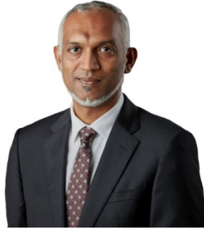
นายโมฮาเหม็ด มูอิซซุ (Mohamed Muizzu)