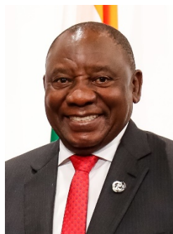
Matamela Cyril Ramaphosa