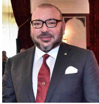
สมเด็จพระราชาธิบดีโมฮัมหมัดที่ 6 (King Mohammed VI)