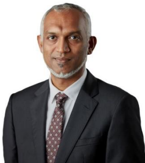
นายโมฮาเหม็ด มูอิซซุ (Mohamed Muizzu)