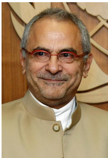
นายโฮเซ รามอส ฮอร์ตตา (José Ramos-Horta)